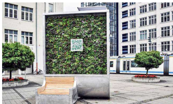
Un city tree. On dirait un tableau végétal!