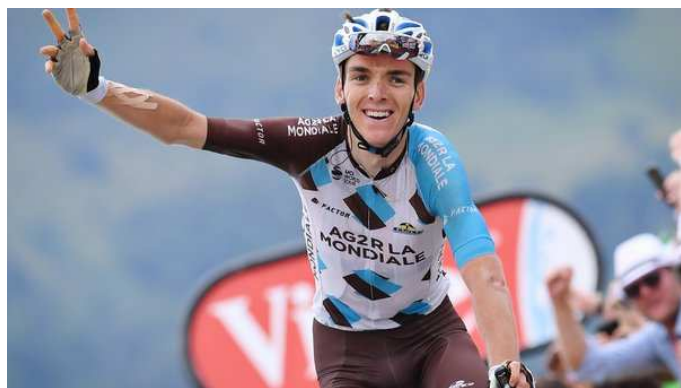
Romain Bardet, 2eme au tour de France 2017

Christopher Froome, aussi appelé Chris Froome est né le 20 mai 1985 (32 ans) à Nairobi au Kenya. C'est un coureur britannique, membre de l'équipe SKY. Il a remporté 4 fois le tour de France en 2013, 2015, 2016 et 2017, et a été médaillé de bronze en contre la montre aux JO en 2012 et 2016.