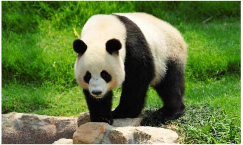
Un panda géant.

A un an, le panda a une épaisse touffe de fourrure qui lui permet de survivre à l'hiver à venir. Il peut se nourrir de tiges de bambous et accompagne sa maman lors de la quête de la nourriture.