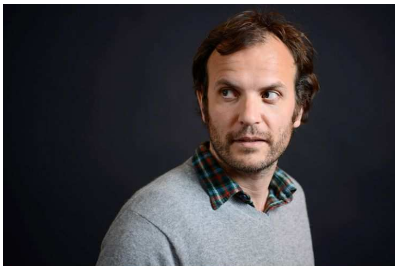
Timothée de Fombelle