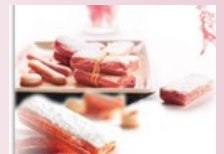
Les biscuits roses de Reims