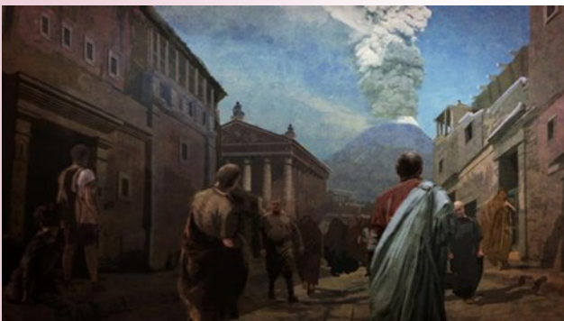
Pompéi avant l'explosion.

J'ai bien aimé cette ville car j'ai trouvé que c'était très intéressant de voir ça après une éruption et de revenir dans le temps. J'ai aussi visité Herculanum.