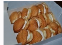
Les bouffettes de Mens