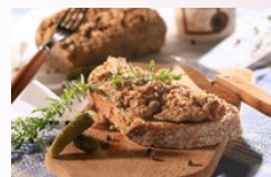
Les rillettes du Mans