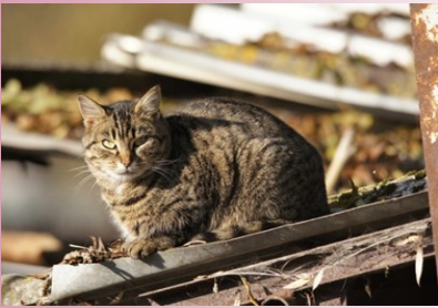
Le chat de gouttière

Savez-vous que les chats domestiques sont des chats qui habitent chez les hommes, ou habitent dans les rues des villes que l'on appelle les chats de gouttière ?