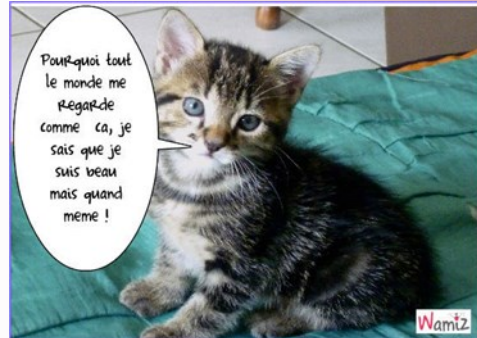
Le chat domestique