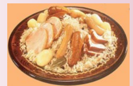
La choucroute de Strasbourg