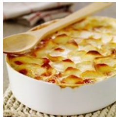
Le gratin dauphinois