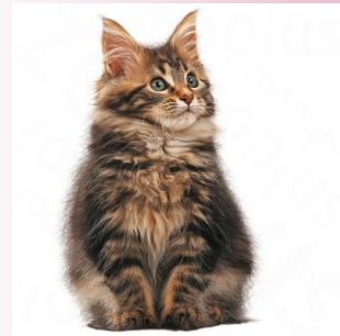
Le maine coon