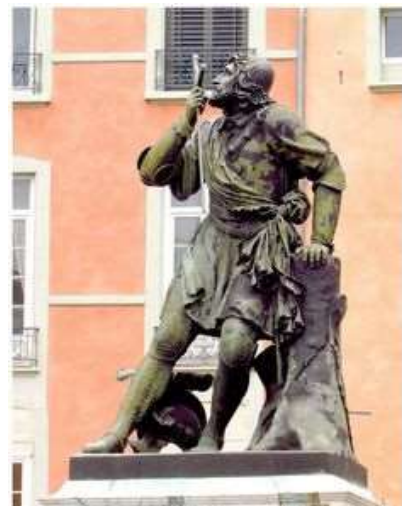
La statue de Bayard, toujours visible sur la Place Saint André à Grenoble, à 5 minutes du collège.