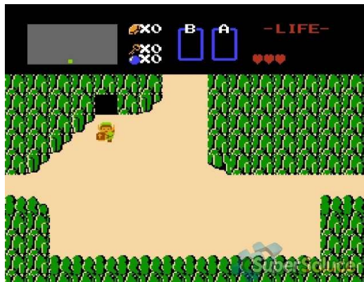
En haut : premier graphisme de Link

À droite : Zelda Breath of the wild (dernier jeu Zelda sorti à ce jour, quelle évolution !)