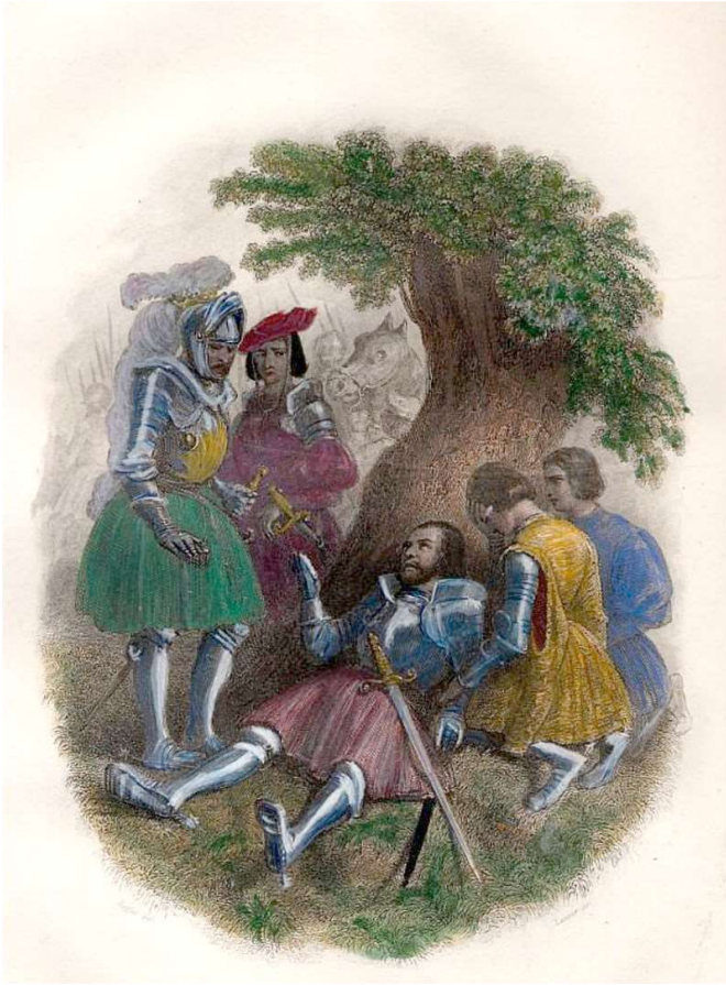
Chevalier Bayard mourant, il a été mortellement blessé par un coup d'escopette dans le dos le 29 avril 1524

Vous savez qui est Pierre Terrail ??? Un petit effort, je suis sûr que vous l'avez sur le bout de la langue... C'est le Seigneur de Bayard, le célèbre chevalier qui a donné son nom à notre rue et à notre école.